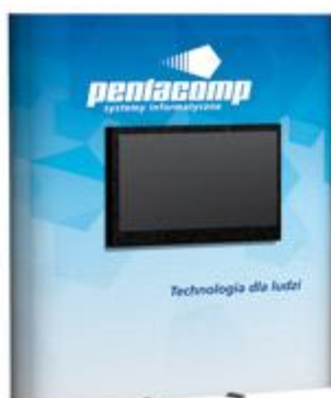
ścianki z monitorem LCD