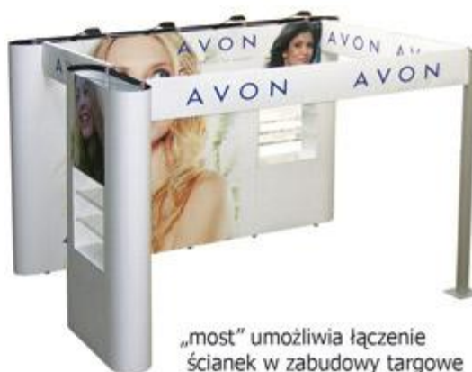
„most” umożliwia łączenie ścianek w zabudowy targowe