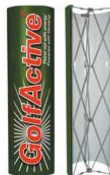
„tower” - kolumna z grafiką dookoła