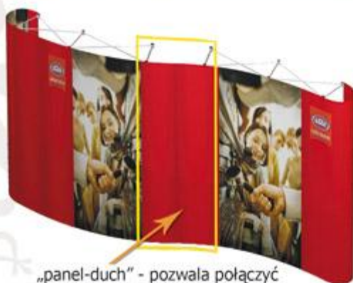
„panel-duch” - pozwala połączyć kilka ścianek pod dowolnym kątem