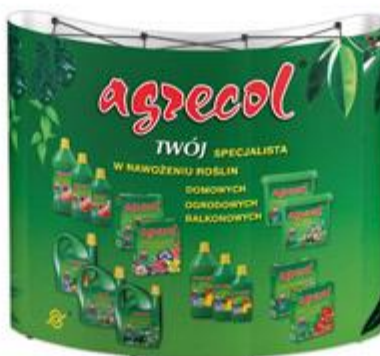
grafika na stronie wypukłej