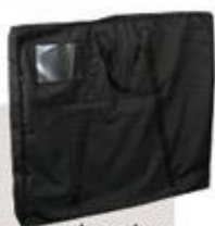
pokrowiec na konstrukcję