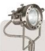
lampka „robot” moc: max 50W