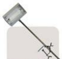
lampka „alu” moc: max 300W